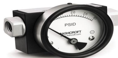
MODELO : 1130 1131